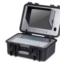
1 × Pannello di controllo